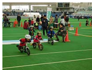
ランニングバイク体験コーナー