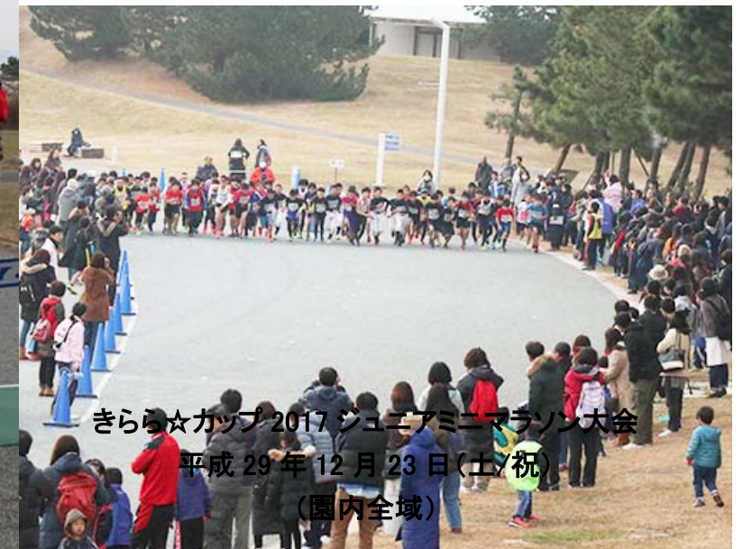
きらら☆カップ 2017 ジュニアミニマラソン大会 平成29年12月23日(土/祝) (園内全域)