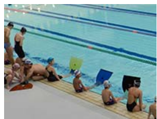
フィンスイミング体験会