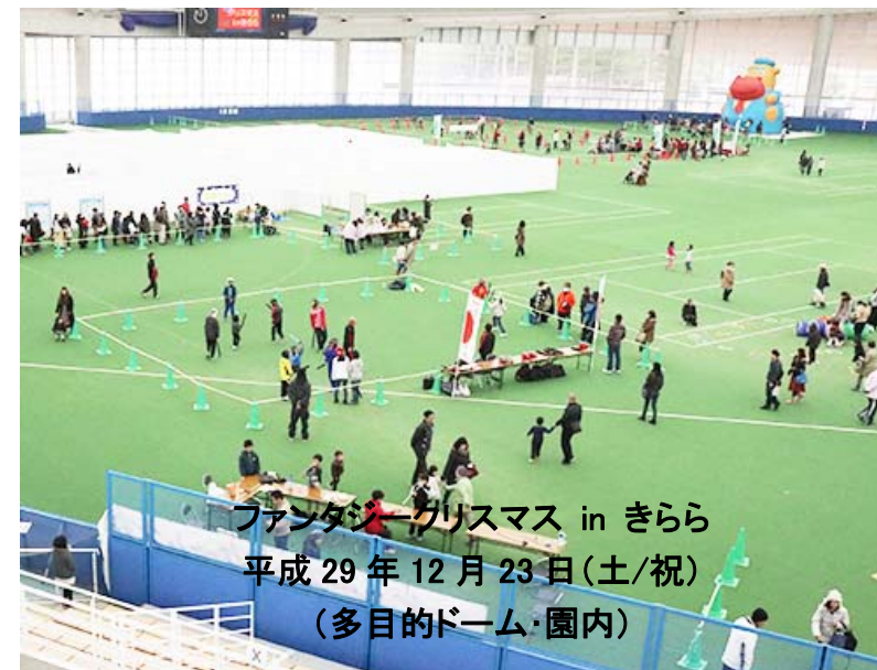
ファンタジークリスマス in きらら 平成29年12月23日(土/祝) (多目的ドーム・園内)